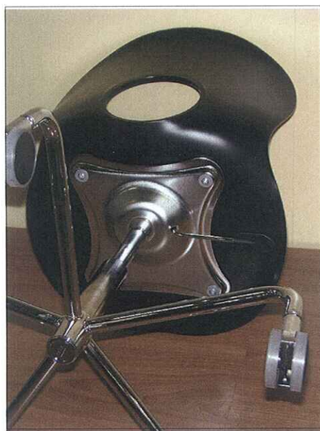
Vista da sotto

La denominazione e l'eventuale descrizione del campione sono dichiarate dal cliente; il CATAS non s'impegna a verificarne la veridicità. Questo rapporto di prova riguarda il campione sottoposto a prova e solo esso. Aggiunte, cancellazioni o alterazioni non sono ammesse. Il rapporto di prova non può essere riprodotto parzialmente. Salvo diversa indicazione, il campionamento è stato effettuato dal cliente.