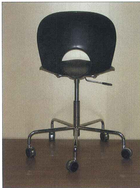
Vista da dietro